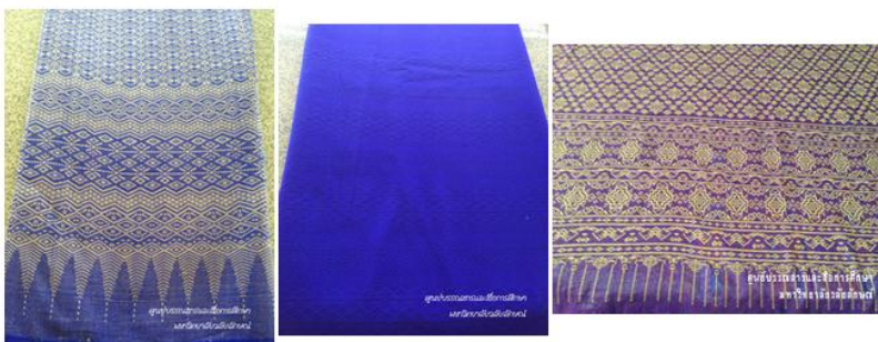
กลุ่มทอผ้ายกเมืองนคร บ้านมะม่วงปลายแขน

ผ้ายกเมืองนครทอด้วยไหมเนื้อละเอียด นิยมเป็นสี่เหลี่ยมเกือบทั้งผืน สอดแทรกลวดลายด้วยคันทอง ลวดลายของท้องผ้าและกรอบกรวยเชิงจะมีลักษณะประณีตเหมาะสมกับเป็นของราชสำนัก มีลักษณะประณีตเหมาะสมสำหรับใช้เป็นผ้านุ่งโจงกระเบนหรือผ้านุ่งแบบหน้านาง ผ้ายกเมืองนครมีลวดลายดั้งเดิมได้แก่ ลายดอกพิกุล ลายดอกมะลิร่วง ลายดอกลิ้นเขา ลายดอกพิกุลแก้ว ลายกรั้วรอง ลายราชวัติ ลายสับประคต ลายดอกเขมรกลม ลายแมงมุมเก้าแย้ง ลายดอกเขมร ลายดอกจัน ลายดอกกรัก ลายเขมรหรือลายพระตะบอง ลายลูกแก้ว ลายคดกริช เป็นต้น