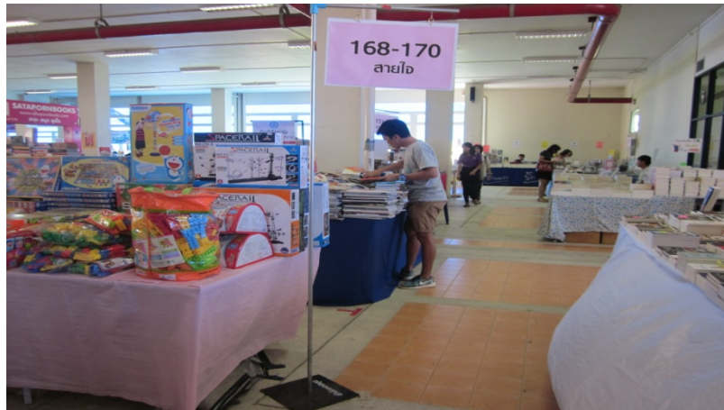
ป้ายชื่อร้าน