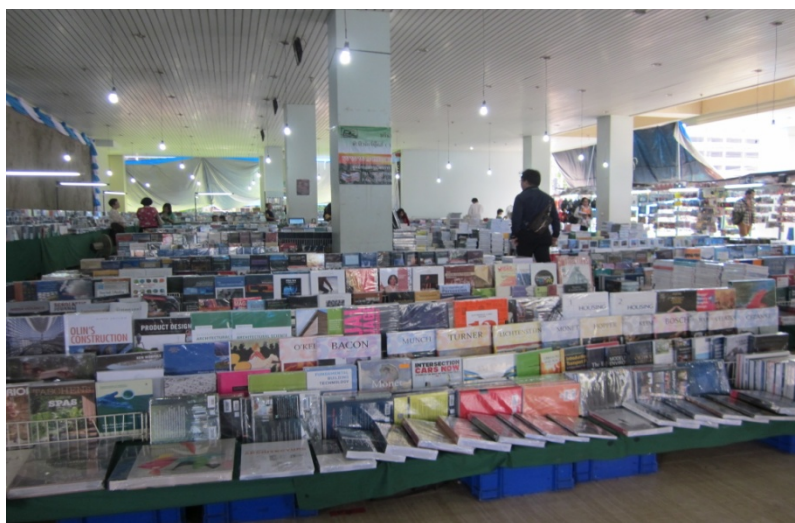
พื้นที่ร้าน พีบี จำนวน 40 บูท